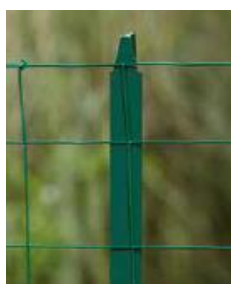
TE a T sloupek